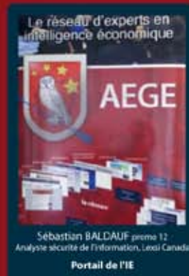
Sébastien BALDAUF promo 12 Analyse sécurité de l'information, Lexip Canada Portail de l'IE